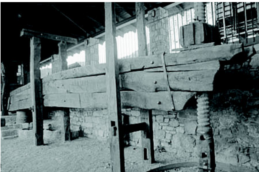
Panillo (enero 2012)