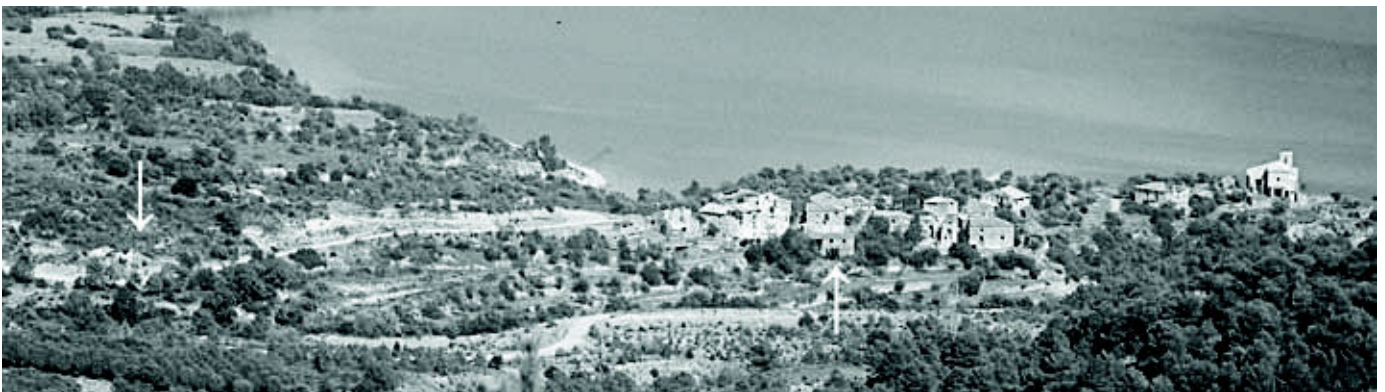
Mipanas a orillas del pantano de El Grado; las flechas indican la ubicación de los molinos

Después de la larga introducción, publicada en el número 125 de la revista, ya es tiempo para ponernos en acción e ir ‘a la búsqueda’ de un molino. No hace falta andar muy lejos para encontrar ejemplos interesantes y por eso vamos a visitar Mipanas que se ubica justo fuera del Sobrarbe, en la comarca del Somontano de Barbastro. En este pueblo hay, a tiro de piedra, dos molinos que son buenos ejemplos de las distintas fases del desarrollo de los aceiteros en la zona. Aunque ambos se encuentran en un estado precario, siguen siendo un material de estudio fascinante.