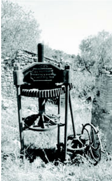
La Muela, Naval (octubre 2007)