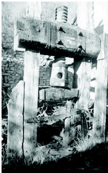
Sieste (diciembre 2006)