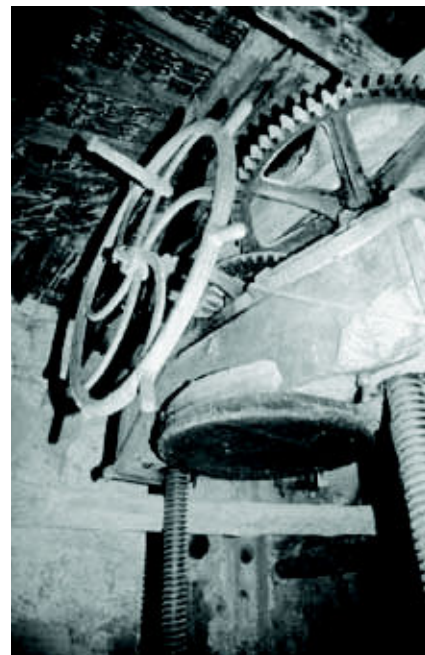
Olsón (Noviembre 2012)

En Mondot, Troncedo y Olsón encontramos una prensa de dos columnas y viga de madera. Este modelo (también conocido como la prensa Calabrica) consta de dos palos con tornillo.