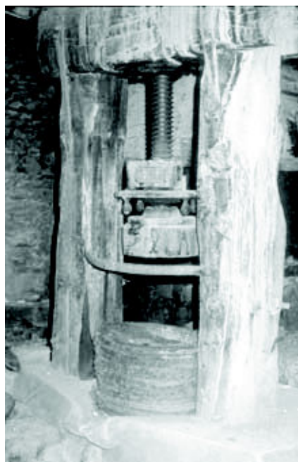
Almazorre (diciembre 1994)