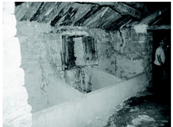
Troncedo: antes de la renovación - junio 2003

Antes de comenzar los trabajos del prensado, se lavaban las olivas. La regulación de la temperatura en el recinto era muy importante. Por un lado, para obtener un buen líquido, una temperatura de al menos 20 grados era imprescindible. Por otro lado, la temperatura no podía alcanzar los 25 grados para no acelerar la evaporación de los contenidos aromáticos de la masa que iba a ser sometido a la acción de la prensa. Para obtener una buena calidad de aceite comestible, fue necesario tratar las olivas en el plazo de 24 horas. Cuando el prensado de la cosecha tardaba demasiado, las olivas empezaban a fermentar, lo que daba una calidad muy inferior. No obstante, el maestro, que sumergía su brazo en el depósito para probar el estado de las olivas, prefería las frutas ya fermentadas, porque eso facilitaba el proceso de prensar. En aquellos tiempos la calidad del producto no tuvo la misma importancia que hoy día, porque el uso fue sobre todo para la iluminación, y apenas se usaba como comestible.