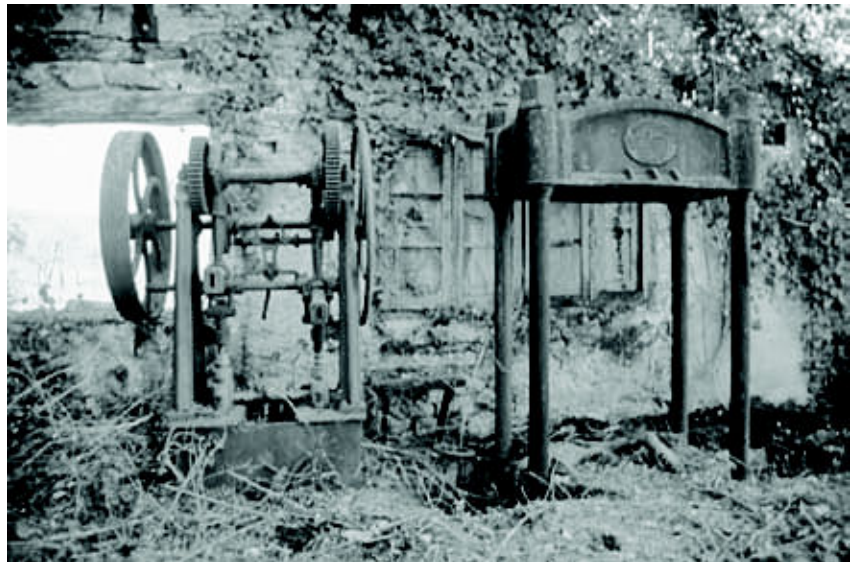
Centenera (marzo 2004)