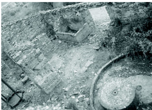
Mipanas: algorín y muela - enero 2010

Entramos en el recinto del molino por donde en 1994 todavía había una sólida puerta. Hoy día ha desaparecido y en la fachada del aceitero queda solamente un hueco. El plano es rectangular, con el espacio para la prensa de palanca (desaparecida) en la parte de atrás. A mano derecha de la entrada se ve el algorín donde guardaban las olivas recién llegadas. Aquí hay solamente un depósito, pero la mayoría de los aceiteros suelen tener varios. (entre otros en Troncedo, Trillo y Almazorre). A veces un azulejo en la pared, por encima del depósito, indicó el nombre del dueño de las olivas.